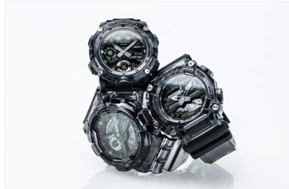
GA-100SKE-8A, GA-2000SKE-8A, GA-900SKE-8A

Amstelveen, 24 februari 2021 – G-SHOCK introduceert maar liefst zes nieuwe modellen in de populaire Skeleton-horlogelijijn met transparante banden en kasten. Door zijn trendsettende nieuwe stijlen te voorzien van een tijdloos zwart-wit kleurenschema heeft de horlogemaker zijn populairste modellen uitgerust met een minimalistische, futuristische look.