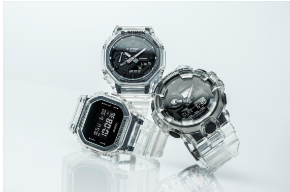
DW-5600SKE-7ER, GA-700SKE-7A, GA-2100SKE-7A

Futuristisch minimalisme gecombineerd met het iconische G-SHOCK-design