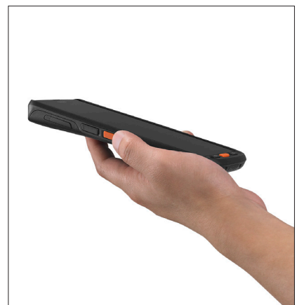
Casio ET-L10 Mit großem 5,7" LCD-Display