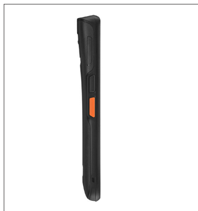
Casio ET-L10 Flaches und leichtes MDE-Gerät mit Android™ 9 und integriertem 1D/2D-Imager